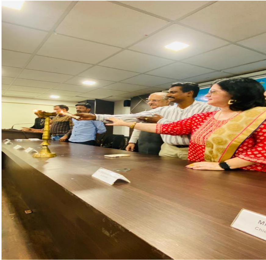
Inaguration Ceremony of Heckathon, 2023