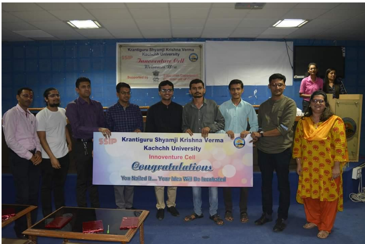
SSIP, KSKV Kachchh University felicitated students