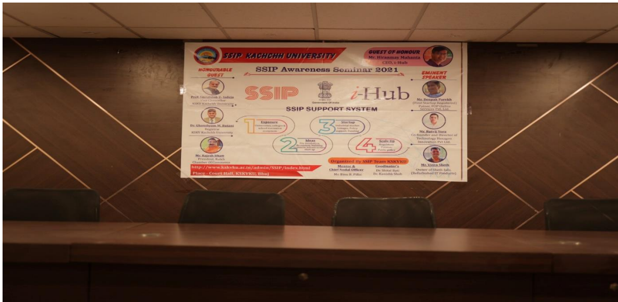
SSIP Awareness Seminar Organised at Court Hall, KSKV Kachchh University