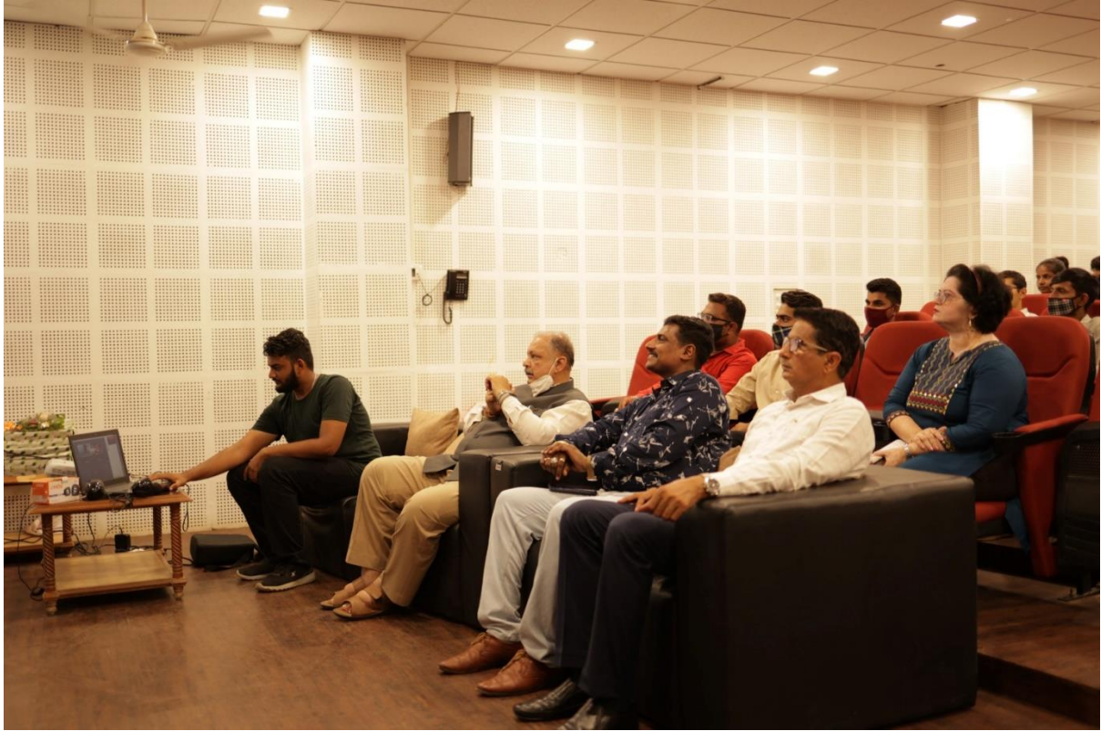
SSIP and IHub awareness program for all Nodal Officers of Departments and Colleges